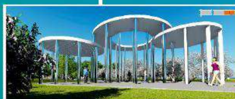
Объект озеленения по ул. Макаренко Мотовилихинский район