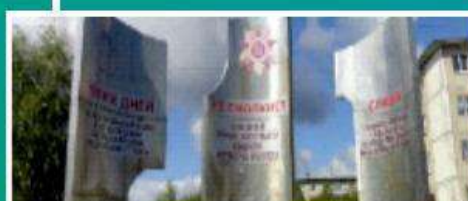
Сквер «Мемориал победы» п. Новые Ляды