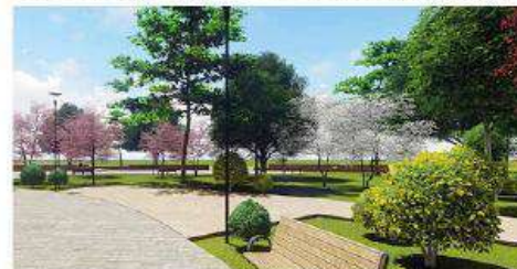
и другие объекты...