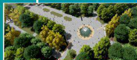
Сквер у клуба им. С. М. Кирова Кировский район