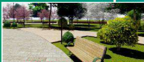
Сквер у здания по ул. Советской Армии, 4 Индустриальный район