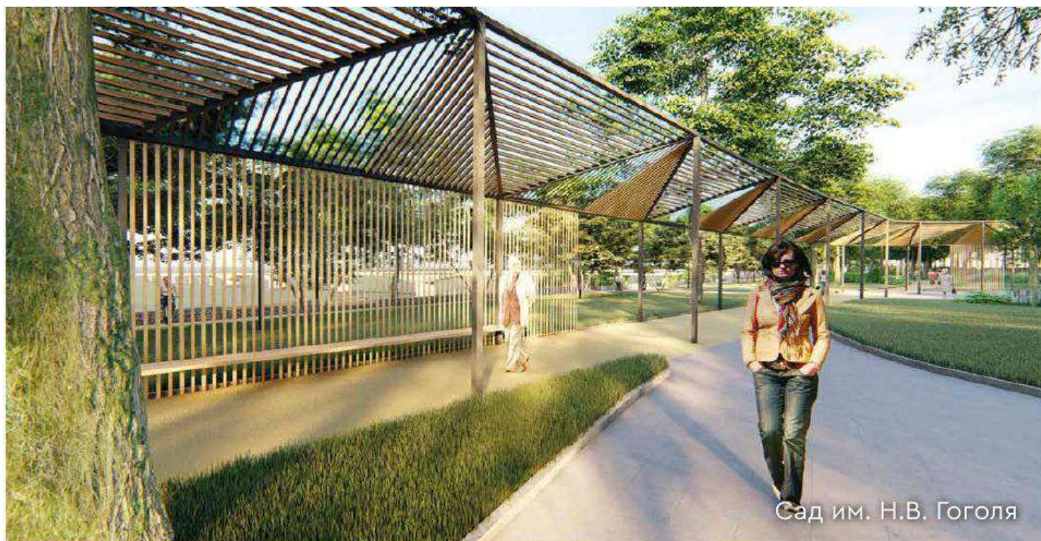
Сад им. Н.В. Гоголя

Голосование по выбору объектов благоустройства – это возможность каждого решить, какие изменения должны произойти в вашем городе.