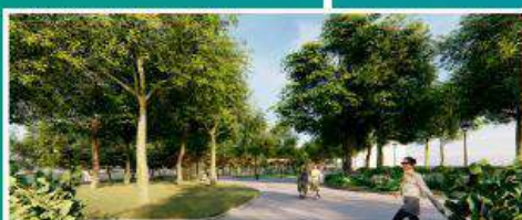
Сад им. Н.В. Гоголя Ленинский район

ОНЛАЙН - ГОЛОСОВАНИЕ ЗА ОБЪЕКТЫ БЛАГОУСТРОЙСТВА