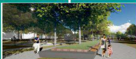
Сквер им. П. Морозова Орджоникидзевский район